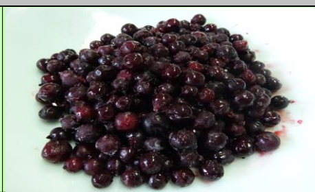
丁寧に過熟した果実のみを加工